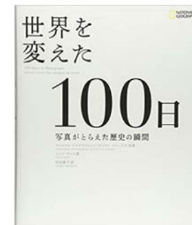
『世界を変えた100日』 ニック・ヤップ