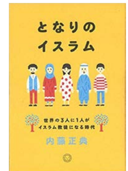
『となりのイスラム』 内藤正典