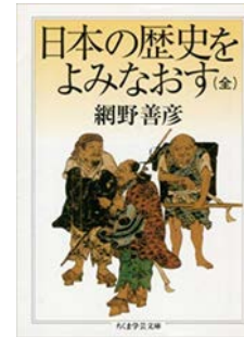
『日本の歴史をよみなおす(全)』 網野善彦