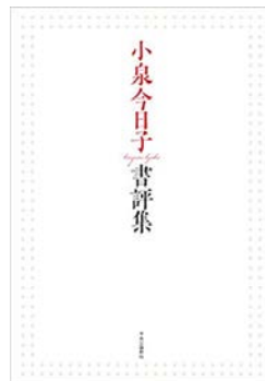
『小泉今日子 書評集』 小泉今日子