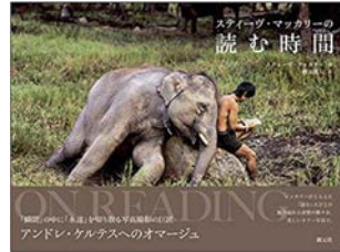
『読む時間』 スティーヴ・マッカーリー