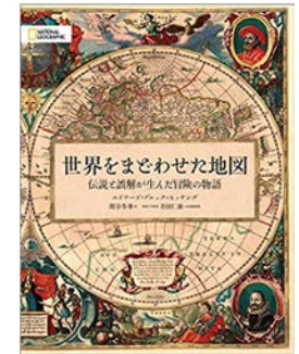
『世界をまどわせた地図』 エドワード・ブルック=ヒッチング